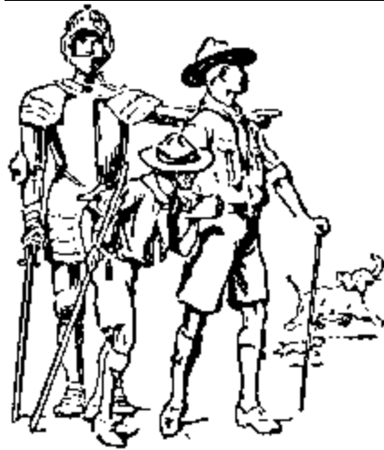
El Jefe de Tropa guía al muchacho con el espíritu de un hermano mayor.

Como palabra preliminar de aliento para los que aspiran a ser Jefes de tropa, quisiera desvanecer el concepto errado que usualmente se tiene sobre que, para llegar a lucirse como Jefe de Tropa, el individuo debe ser émulo del admirable caballero Crichton, es decir, ser sabio... No hay tal cosa.